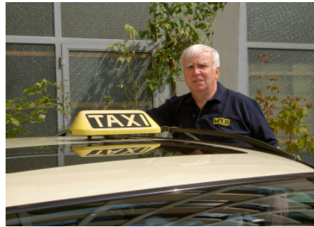
Referent, Kollege und Partner Tony „Wer ehrgeizige Ziele hat, braucht starke Verbündete“

Genossenschaft der Münchner-Taxiunternehmen Engelhardstraße 6 – 81369 München ☎ AB: 089- 76 42 70 www.taxi-münchen.de