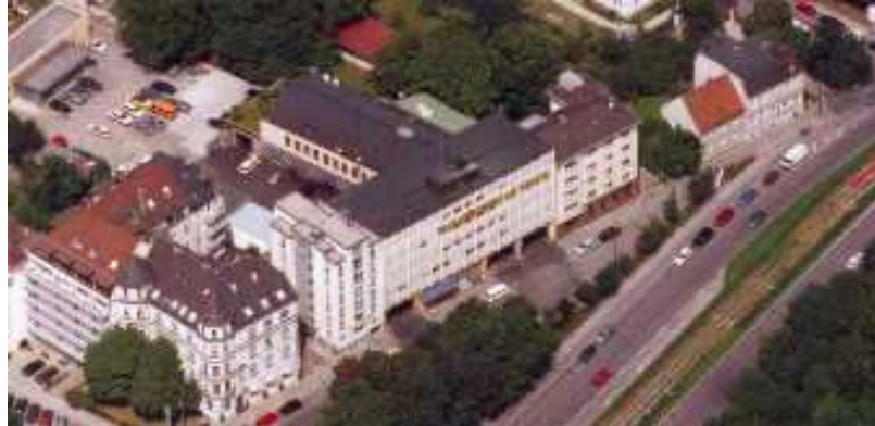
Luftbild des Stammhauses der Taxi-München eG