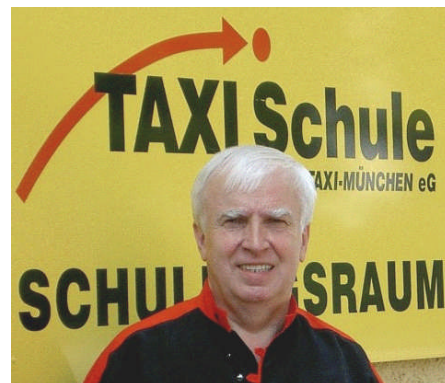
Referent, Kollege und Partner Tony „Wer ehrgeizige Ziele hat, braucht starke Verbündete“

Lieber neuer Taxi- oder Mietwagen-Bewerber, die Taxi-München eG als größter Partner, Zusammenschluss des Münchner Taxi-Gewerbes freut sich, dass Sie sich für den Vorbereitungskurs bei der Taxi-Genossenschaft entschieden haben. Eine Erlaubnis zur Personenbeförderung mit Taxen- oder Mietwagen verlangt einige Voraussetzungen. Wie üblich kommt vor dem Preis der Fleiß!